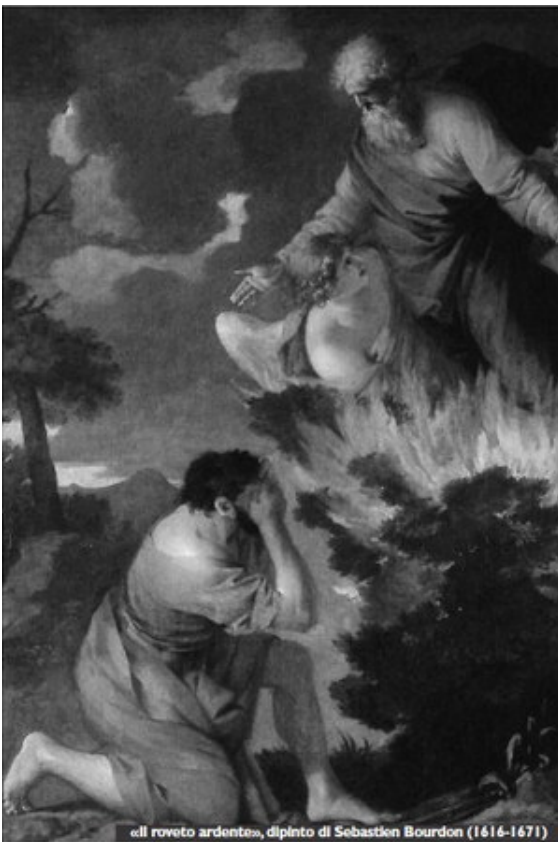
«Il roveto ardente», dipinto di Sébastien Bourdon (1616-1671)

«Penso che la missione del prossimo secolo sarà di reintegrare gli dei», sosteneva negli anni Cinquanta il più celebre e carismatico ministro della Cultura che la Francia ricordi: André Malraux, ufficialmente non credente ma sensibile alle ragioni della trascendenza. E da allora, l'espressione «il XXI secolo sarà religioso o non sarà», ripresa e sviluppata in diverse occasioni dal talentuoso scrittore, è divenuta una sorta di proverbio popolare che trotta nelle teste dei francesi.