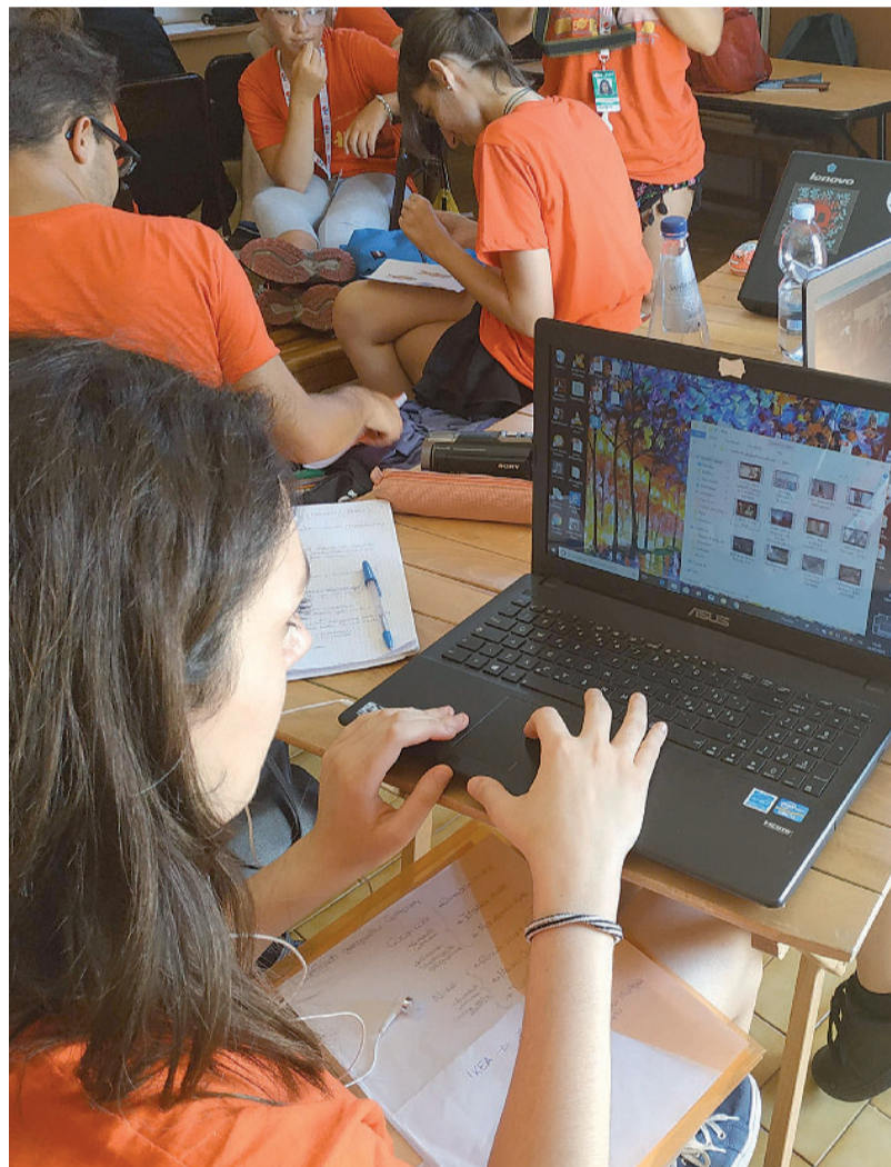
Un'attività del Cgs di Ancona